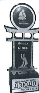
КУБОК ЧЕМПИОНА ТУРНИРА