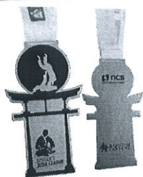
МЕДАЛИ ТУРНИРА РУЧНОЙ РАБОТЫ ИЗ МЕТАЛЛА