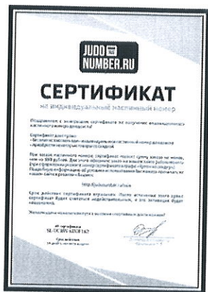
СЕРТИФИКАТ НА ОДНУ БЕСПЛАТНУЮ НАШИВКУ КАЖДОМУ ПРИЗЕРУ СОРЕВНОВАНИЙ