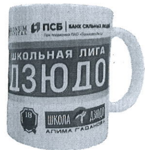
ПРИЗ ЗА ТРЕТЬЕ МЕСТО КРУЖКА С ЛОГОТИПОМ ТУРНИРА