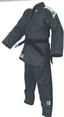
ПРИЗ ЗА ПЕРВОЕ МЕСТО КИМОНО GREEN HILL